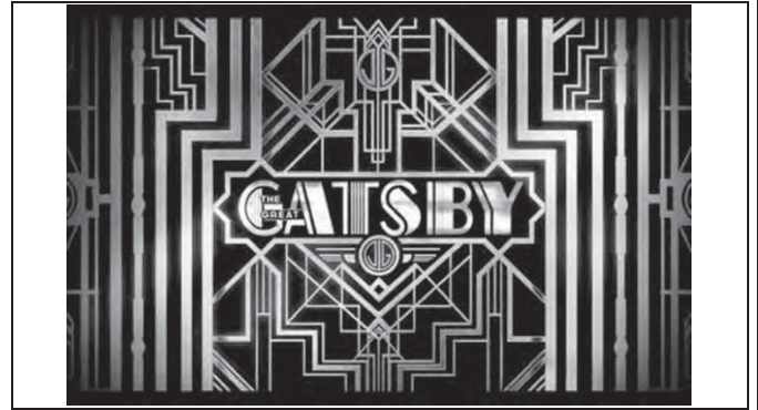
Peças gráficas do filme "O Grande Gatsby". Disponível em: < http://cinemabh.com/wp-content/uploads/2012/12/O-Grande-Gatsby.jpeg > Acesso em: 22 mai 2018.