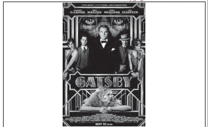
Disponível em: < http://cinemabh.com/imagens/o-grande-gatsby-com-leonardo-dicaprio-ganha-cartaz > Acesso em: 22 mai 2018.

Em O Grande Gatsby , o escritor Nick Carraway deixa o meio-oeste em direção a Nova York na primavera de 1922, uma época em que a moralidade tornava-se menos rígida. Em busca de sua própria versão do Sonho Americano, Nick acaba vizinho de um misterioso milionário festeiro, Jay Gatsby. É nesse ambiente que Nick usa essa experiência para escrever um conto de amores impossíveis, sonhos incorruptíveis e tragédias que espelha os nossos próprios tempos e conflitos. O longa é uma adaptação do livro de F. Scott Fitzgerald.